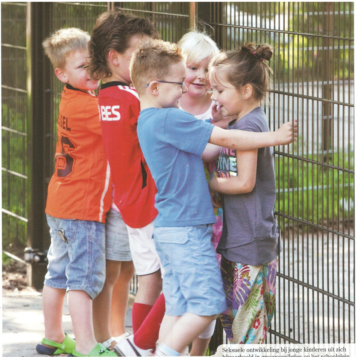
Seksuele ontwikkeling bij jonge kinderen uit zich bijvoorbeeld in groepsspelletjes op het schoolplein

invult vanuit de visie van de school. Het is voor kinderen heel goed als zij op meerdere plekken informatie opdoen over seksualiteit en misschien wel vanuit andere waarden. Zo krijgen zij een breed beeld hiervan. Concreet betekent dit dat je beschrijft waaruit voorlichting op school bestaat, op welke momenten die gegeven wordt en hoe men bijvoorbeeld op school omgaat met seksueel getint gedrag van kinderen (Zwiep, 2010a). Daarnaast kan men in een schoolwerkplan randvoorwaarden beschrijven die bijdragen aan een positief, pedagogisch klimaat, waarin ruimte is voor de seksuele ontwikkeling van kinderen. Zo kan de school zorgen dat er in groep 1 en 2 materiaal is voor kinderen om seksueel getint rollenspel te doen: een dokterstas met inhoud, verkleedkleden of een jongens- en meisjespop. Dit schoolwerkplan geeft een team van leerkrachten op de school een eenduidige richtlijn bij de seksuele opvoeding. Dit voorkomt dat iedere leerkracht voor zich het 'wiel' moet uitvinden.